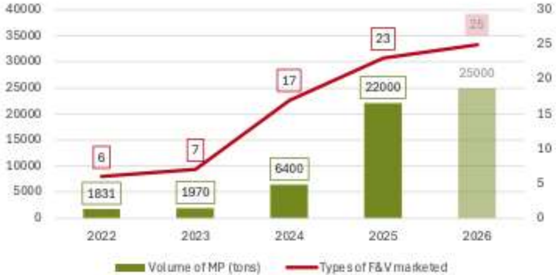
Sortiment & Volume info